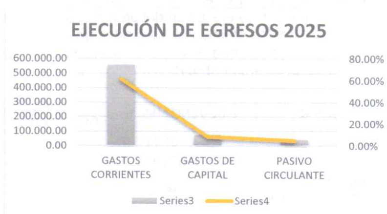
GRAFICO 2 - FUENTE: Ejecución de Egresos 2025 – Unidad Financiera 2025

A continuación, se detalla la ejecución presupuestaria del devengado de los gastos al 31 de diciembre del 2025: